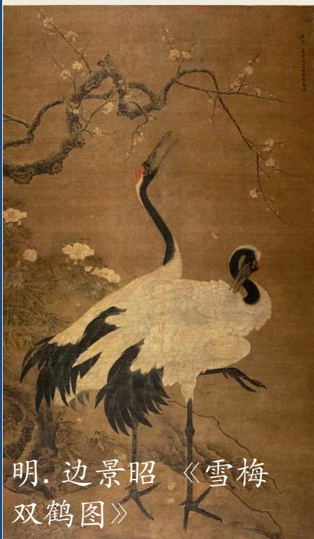
明.边景昭 《雪梅双鹤图》